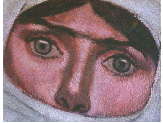
Resim: Nuri İyem

Kadınla erkeğin arasındaki biyolojik, hormonal ve anatomik ayrımların kökü tabiattan kaynaklanmaktadır. Ancak bugünkü tetkikler ve yaşam, bu yapısal farklılıkların beyin gücünü etkilemediği, hatta bu farklılıkların kadına daha fazla özellik ve üstünlükler kazandırdığını göstermektedir.