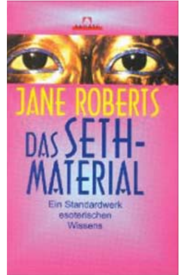
Alıntılar: "Das Seth Material" (Seth Bilgileri) Jane Roberts

(Gelecek sayıda Reenkarnasyon ve Rüyalarımız konusunu incelemeye devam edeceğiz.)